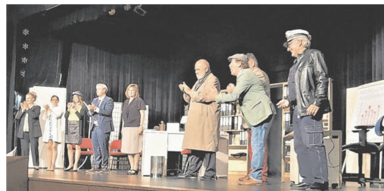
Das Ensemble des Theaters Purkersdorf wurde vergangenen Freitag vom Premieren-Publikum kräftig beklatscht und gefeiert und bedankte sich dafür ebenfalls applaudierend.